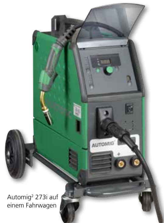
Automig 2 273i auf einem Fahrwagen