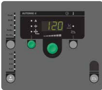
Automig II Bedienfeld