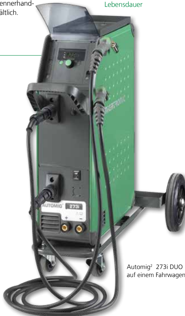
Automig 2 273i DUO auf einem Fahrwagen