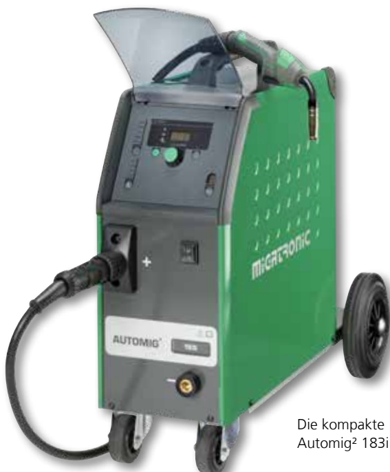
Die kompakte Automig 2 183i